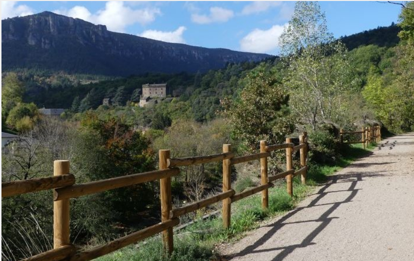
Château de Montvaillant