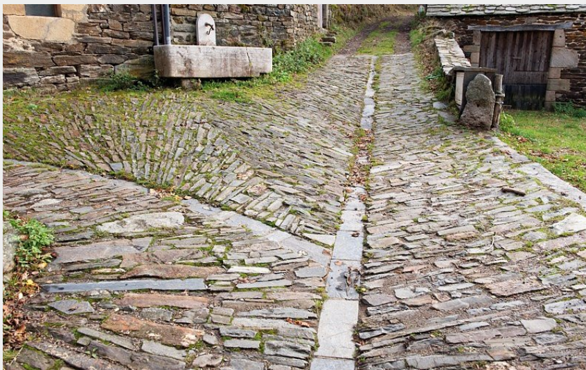
Calade à Aurillac (Guy.Grégoire)