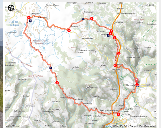
Sur la route des Lac et des Burons

Partez à l'ascension du plateau de l'Aubrac pour profiter des grands espaces au milieu d'une nature encore préservée.