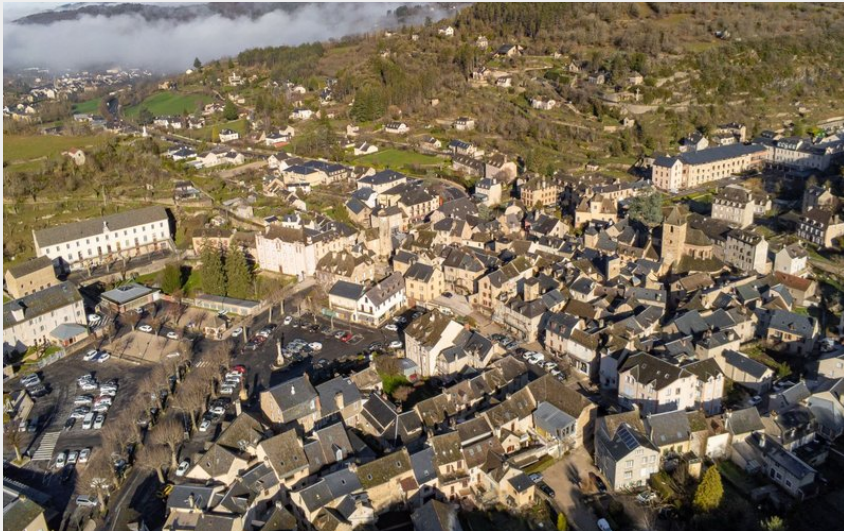
La ville de La Canourgue