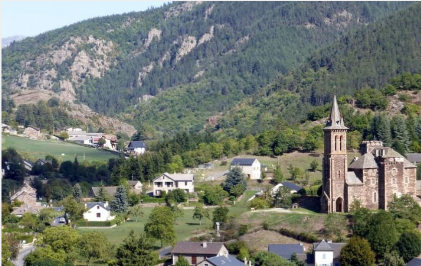
Vue sur Bédouès