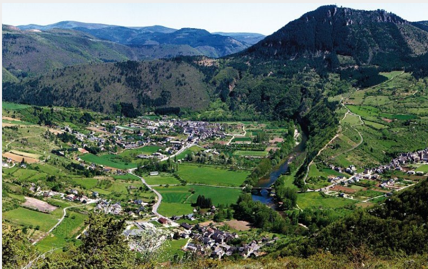
Vallée d'Ispagnac / Quézac