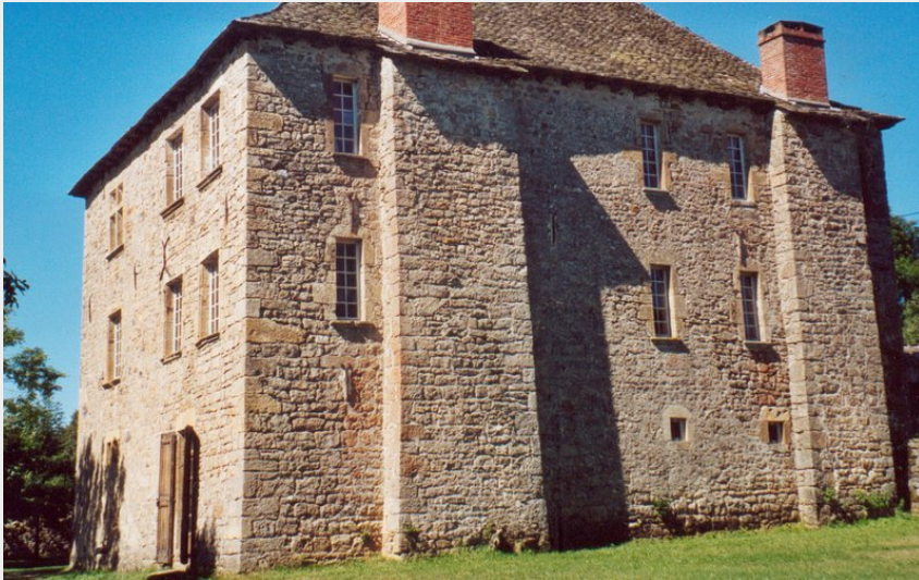
La maison forte de Bahours (PAH Mende & Lot en Gévaudan)