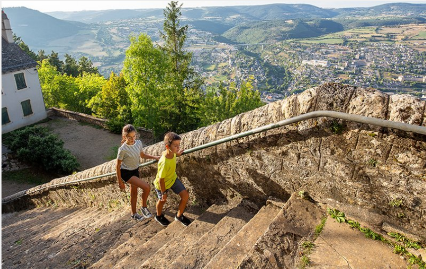
L'Ermitage Saint-Privat à Mende (48)