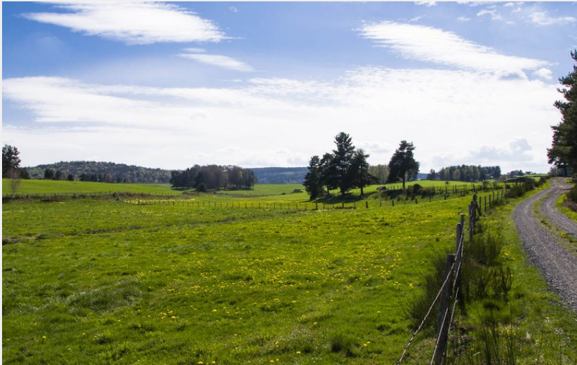
Aux portes de l'Aubrac