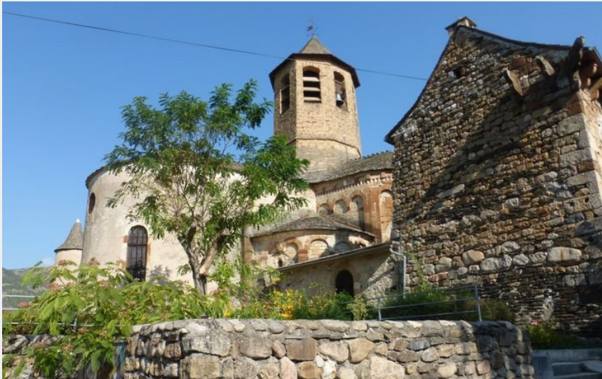
L'Eglise d'Ispagnac