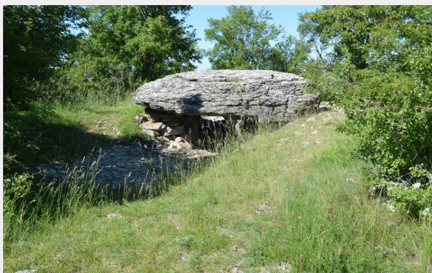
Le Dolmen de Changefege