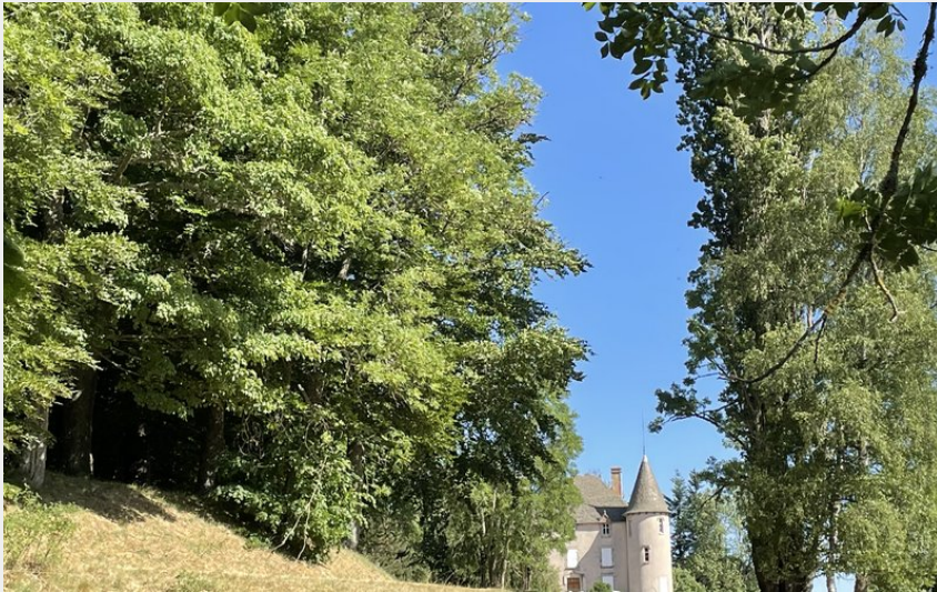
Vue sur le chateau de Soulagès