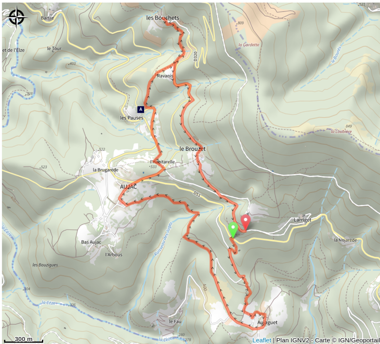
Le hameau des Pauses (A)