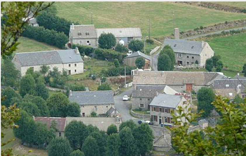
Village de Saint-Laurent-de-Veyrès