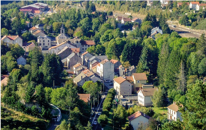
La Bastide-Puylaurent