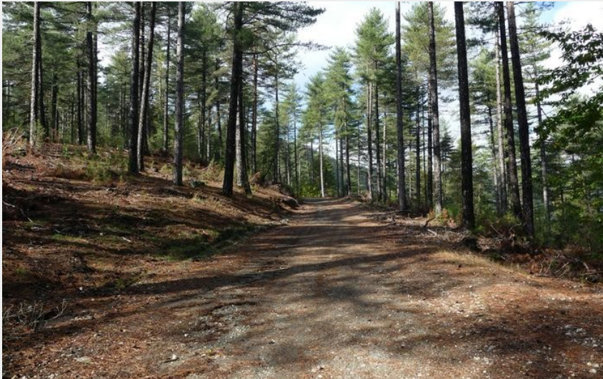
La "route royale" (nathalie.thomas)