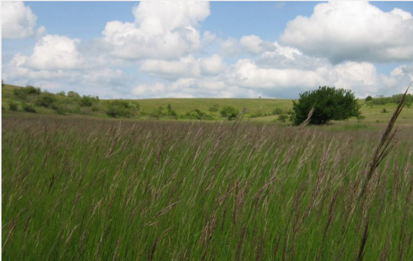
Paysage Causse de Sauveterre