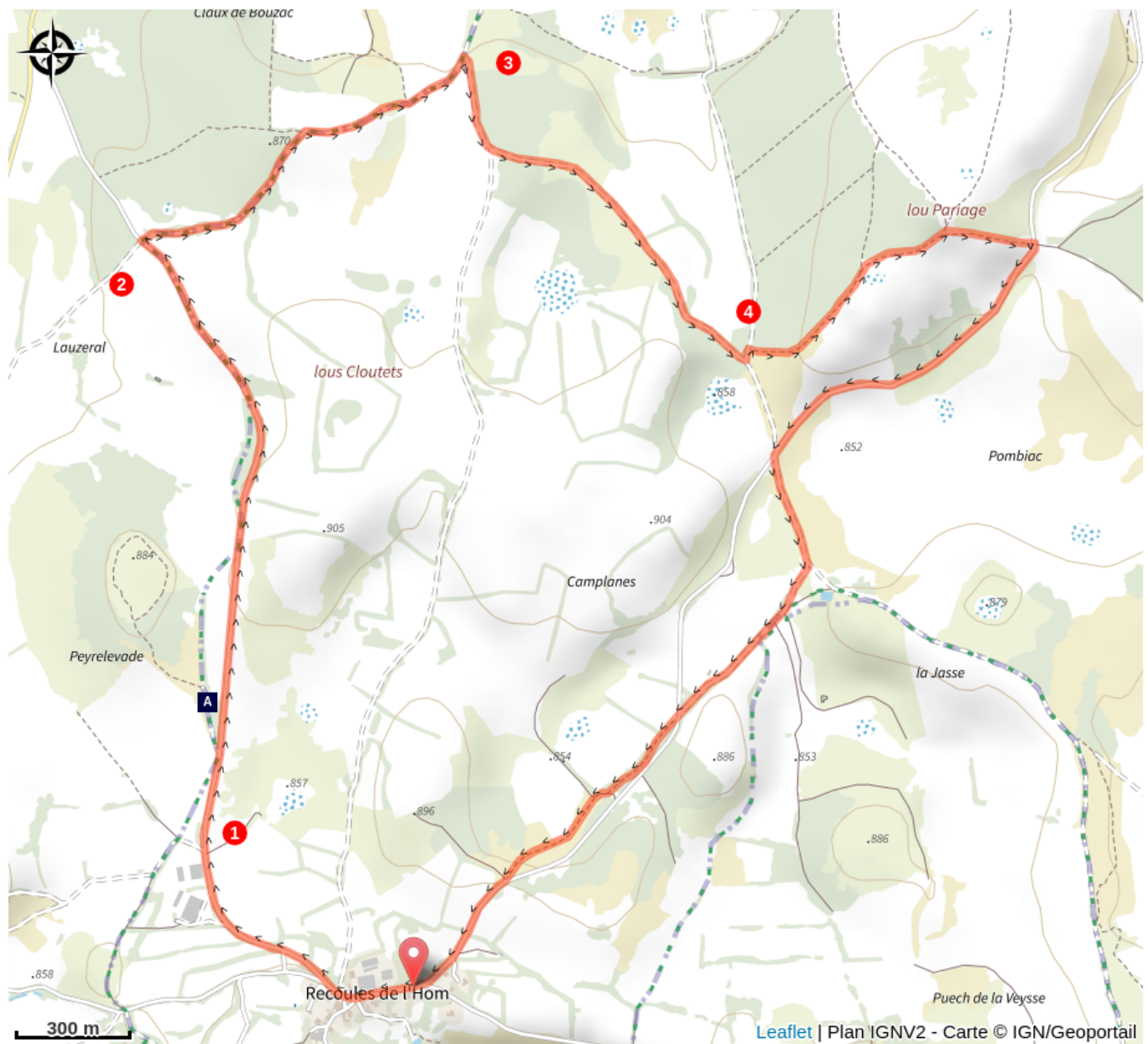
Dolmen de Peyrelevade (A)