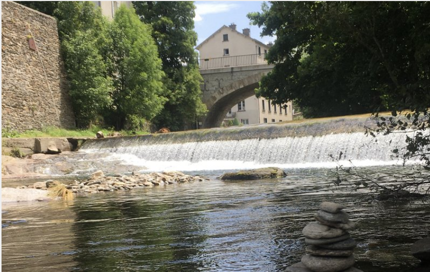
Lot, Bagnols-les-Bains (OT Mont-Lozère)