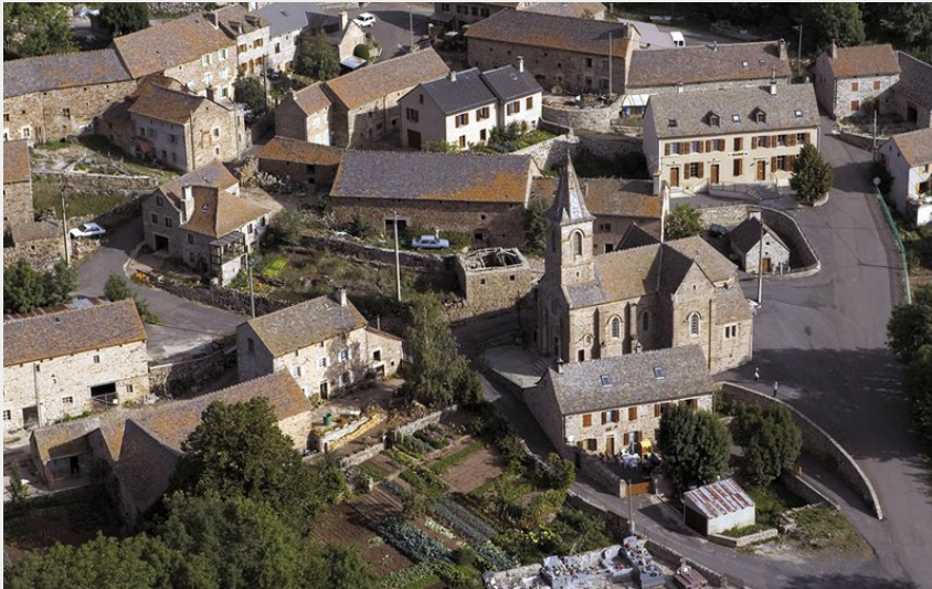
Commune de Pelouse