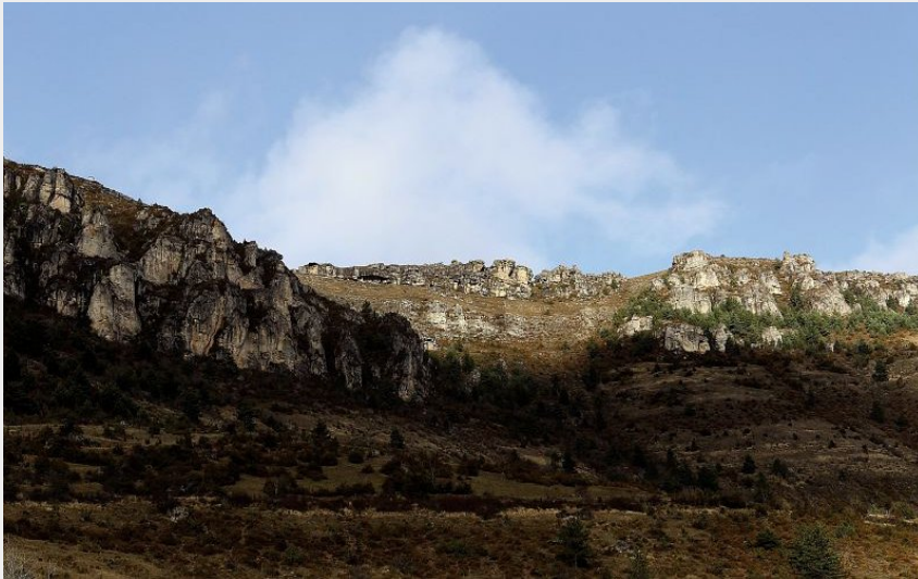
Falaises au-dessus de Salvinsac