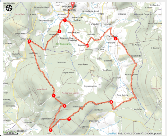
La Margeride

Une randonnée à la demi-journée, qui se déroule principalement sous l'ombre des bois de Margeride, sur de beaux et larges chemins parfois herbeux et caillouteux, mais toujours facilement praticables