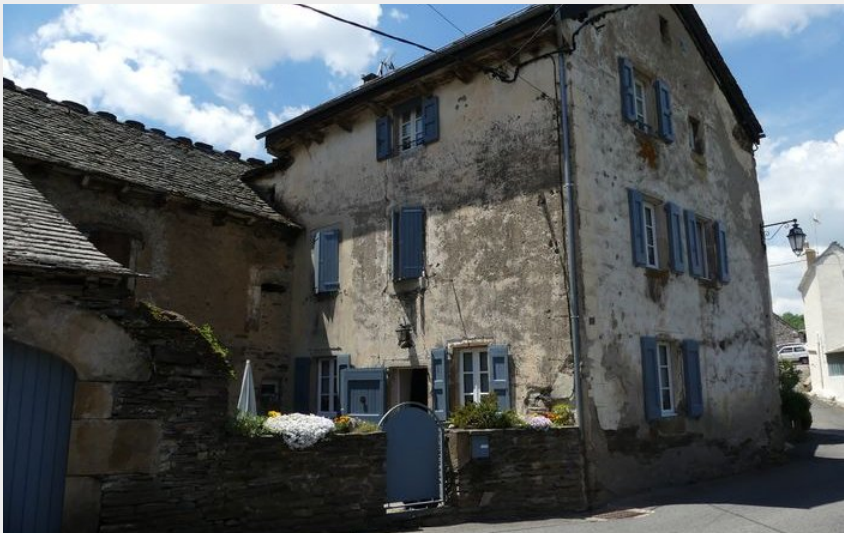
Bagnols les Bains (N Thomas)