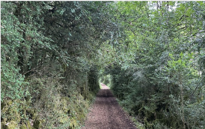
Chemin de buis... (OTAGDT)