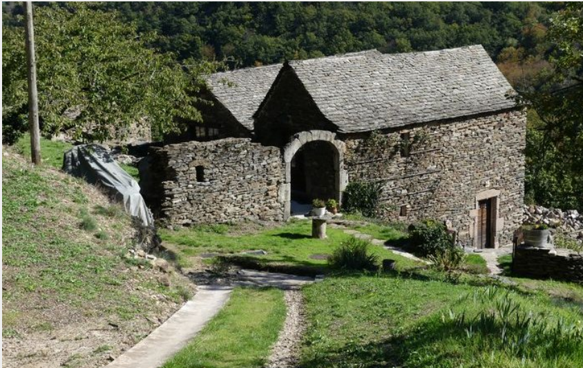
Le Villaret