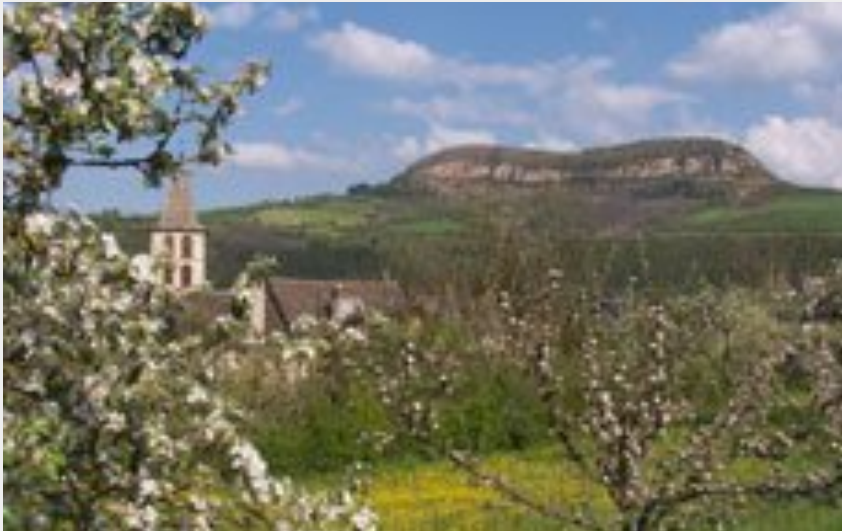
Le Truc de St bonnet