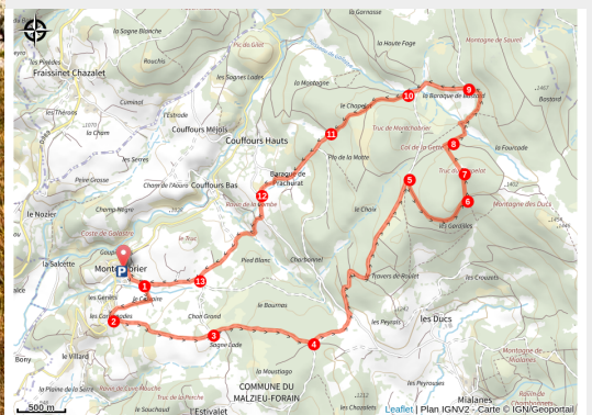
Le truc du Chapelat