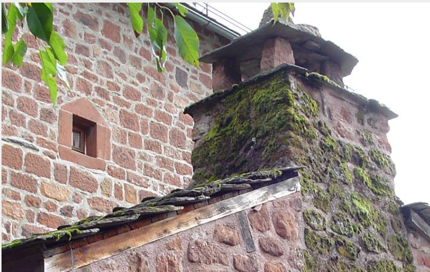
Cheminée en grès rouge