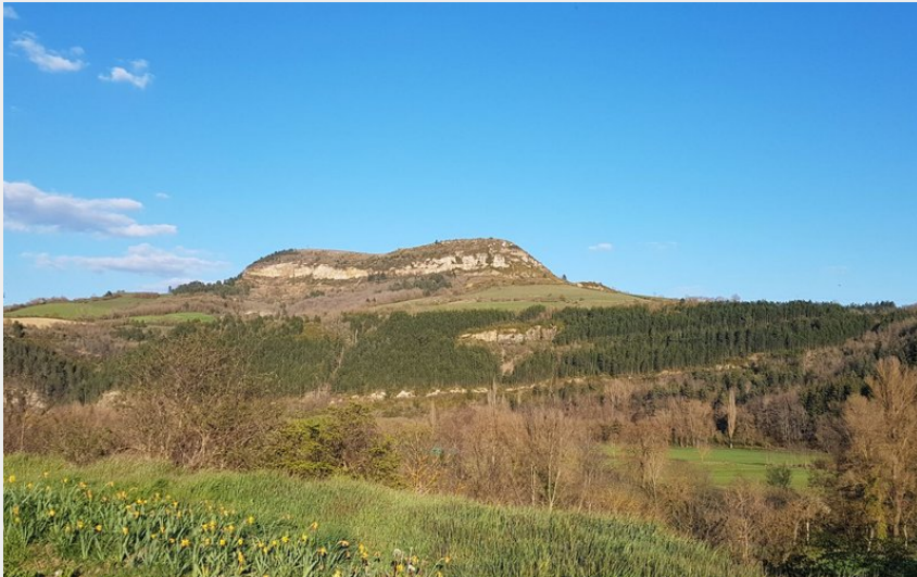
Le Truc de Saint-Bonnet depuis Chirac