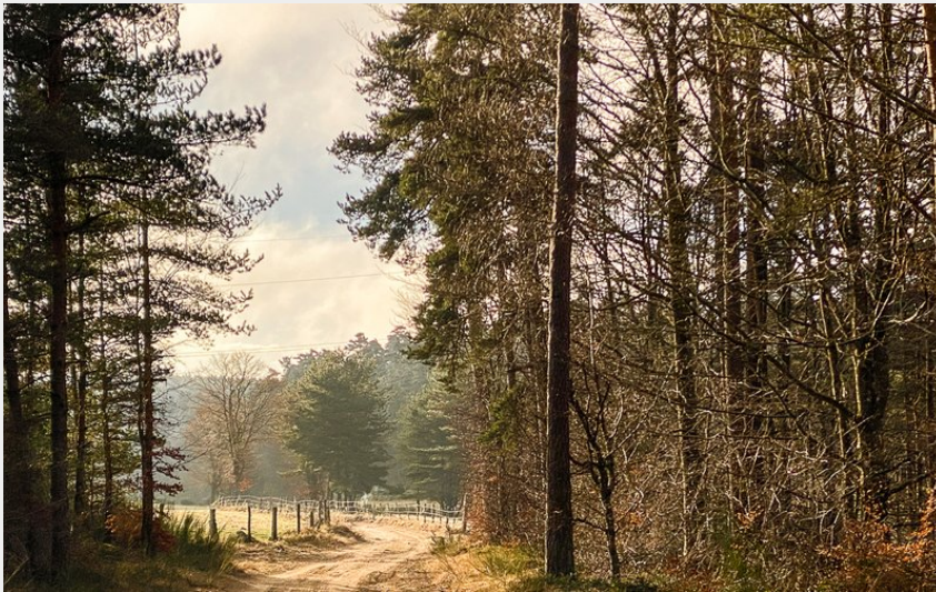
Matin de janvier