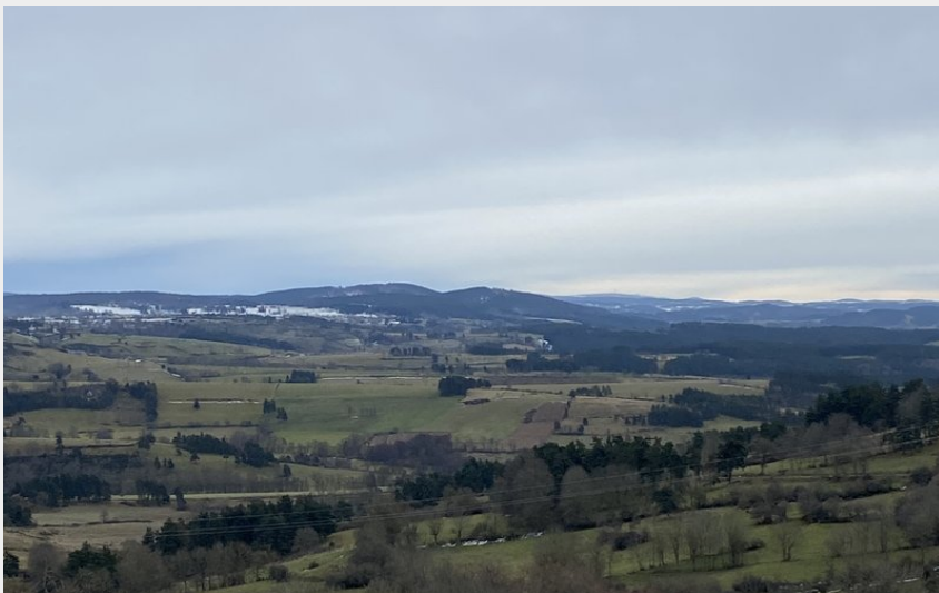
Vue sur les crêtes de la Margeride jusqu'au Truc de Fortunio (M. Larguier - OT Margeride en Gévaudan)