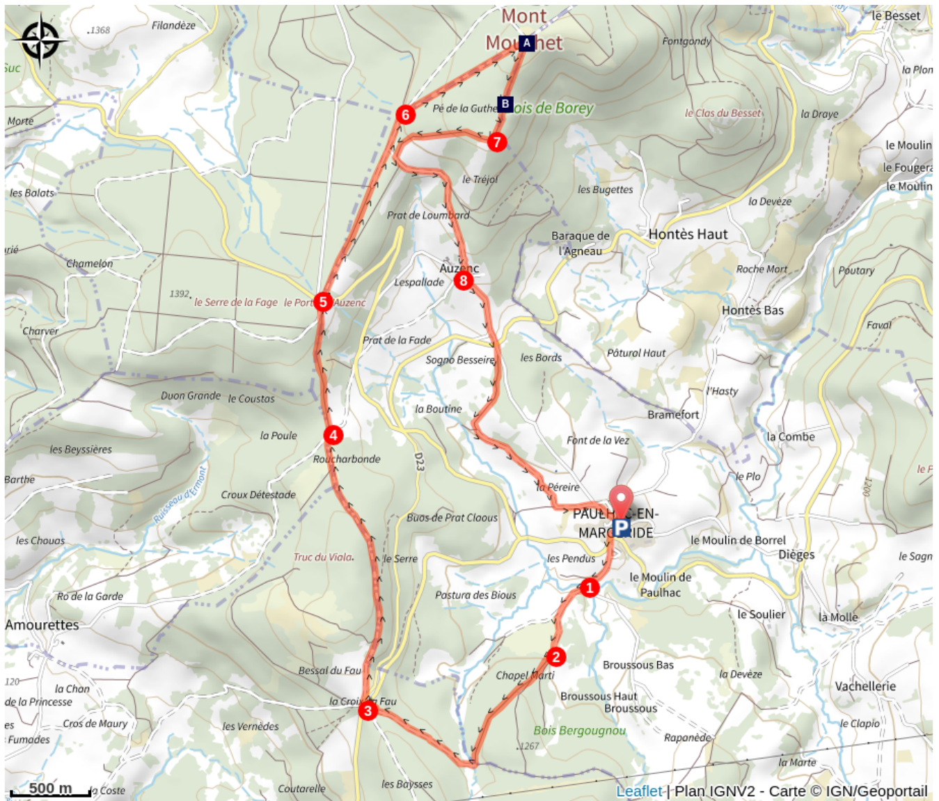
Le Mont Mouchet (A)