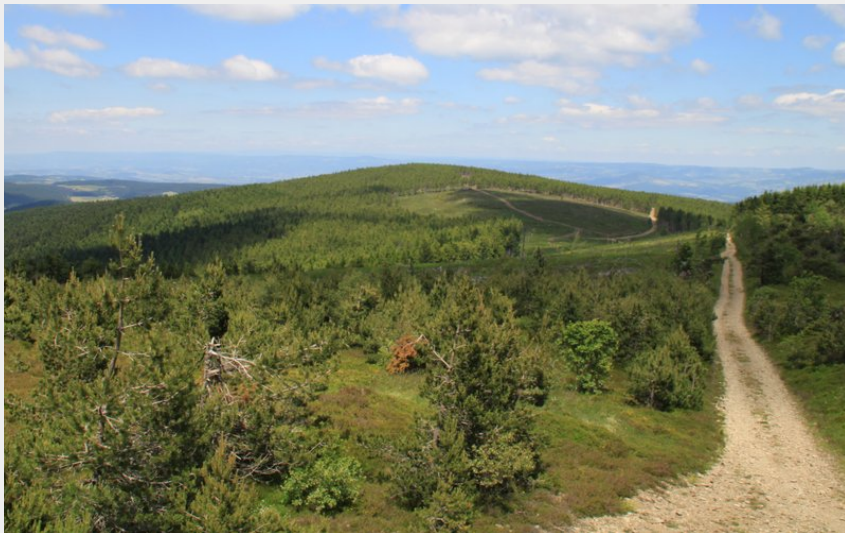
Le Mont Mouchet