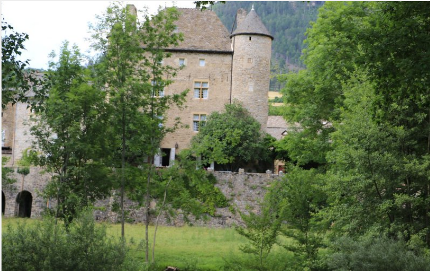
Château privé de Ressouches