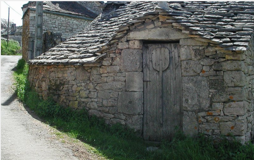
Four à pain du Falisson sur le Causse du Sauveterre