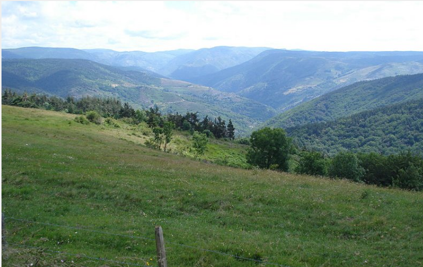
Col du Thort (Havang(nl))