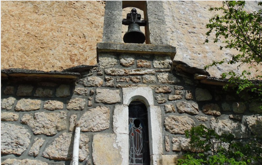
Chapelle St Hillaire