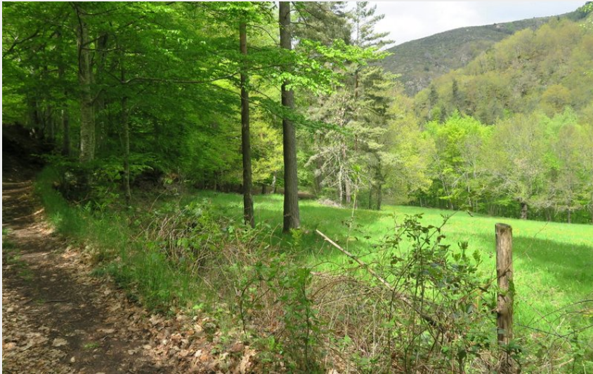
Entre ombrages et trouées de verdure ensoleillées