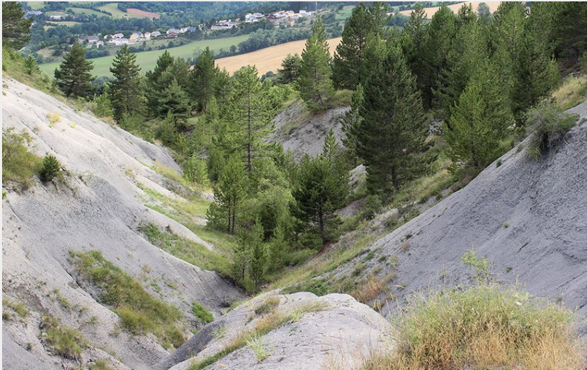
Marnes Bleues - Falaises de Barjac