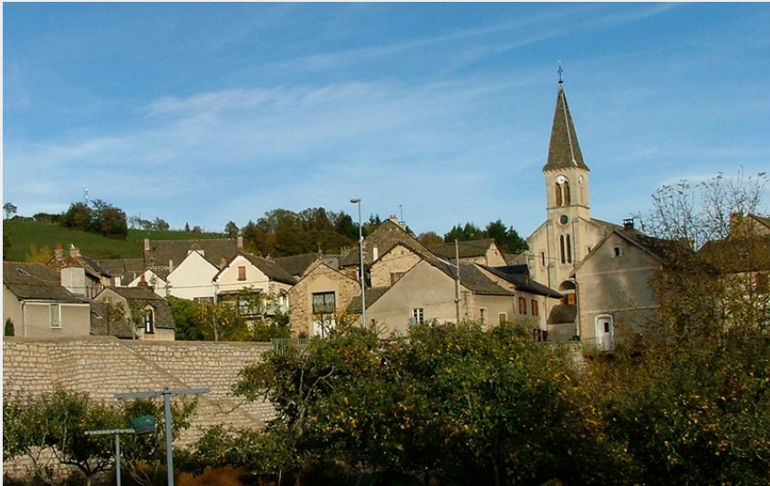
Badaroux village