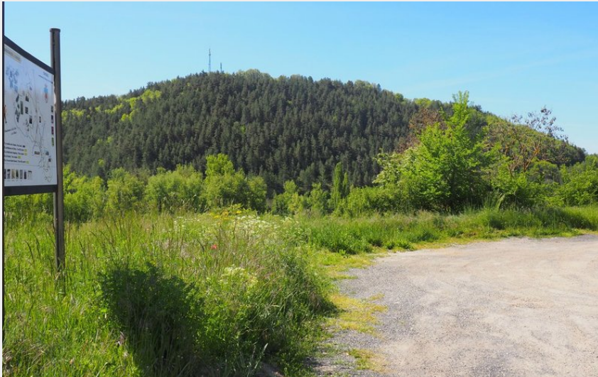
Départ rando