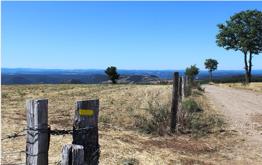
Vue sur le Sud-Ouest depuis la draille de la Boulaine