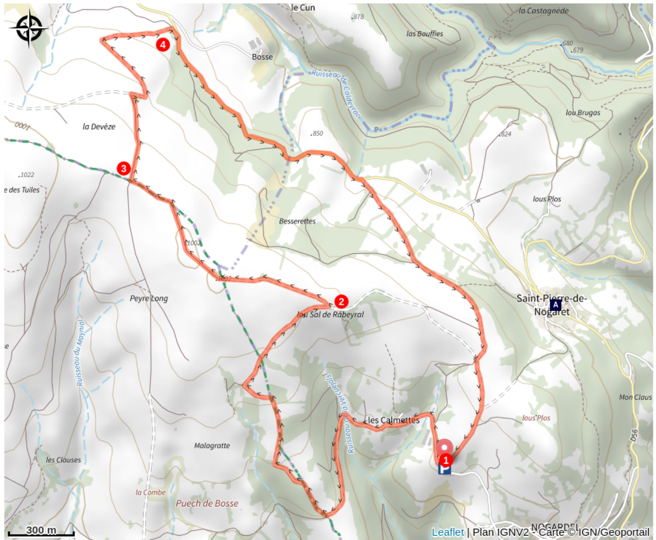
Eglise Romane de St Pierre de Nogaret (A)