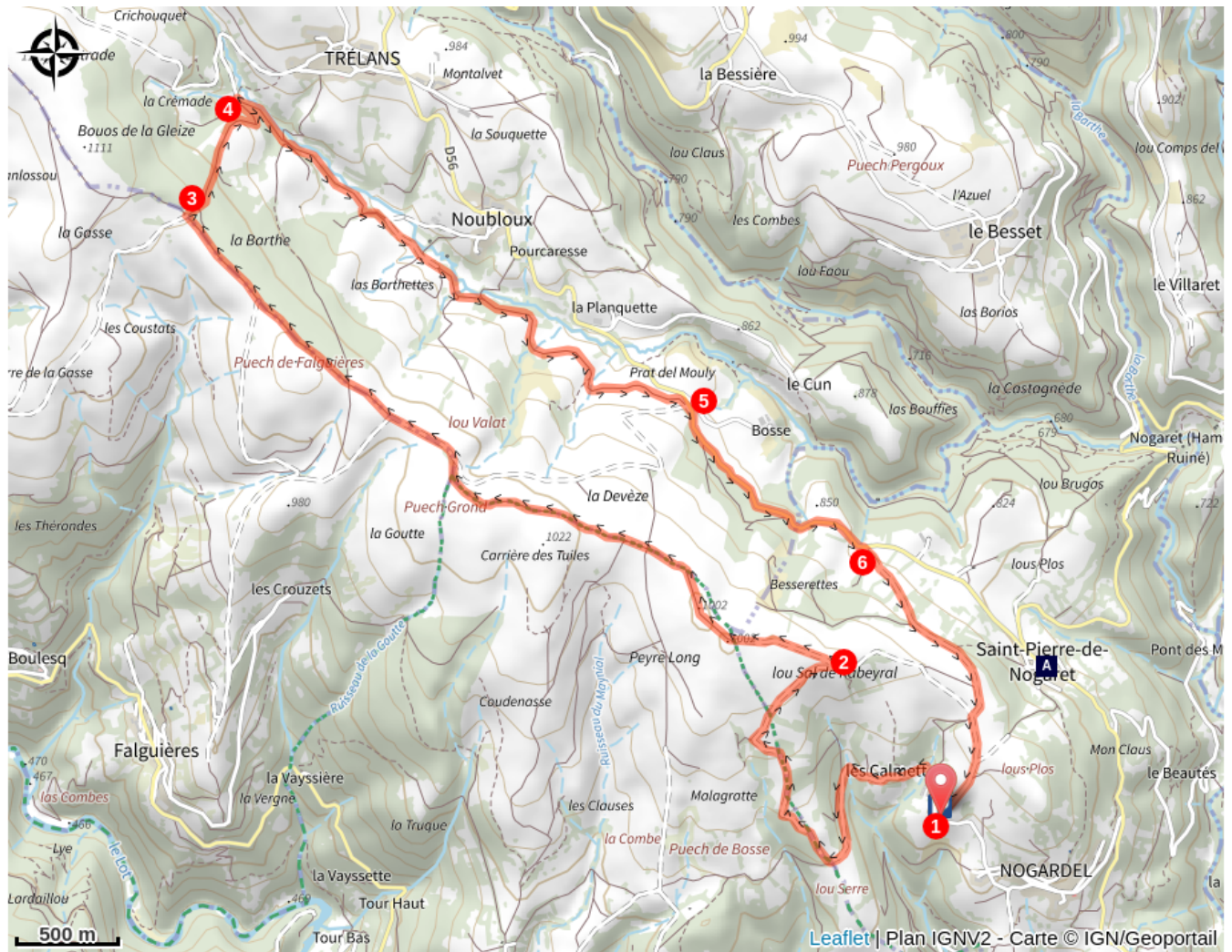
Eglise Romane de St Pierre de Nogaret (A)