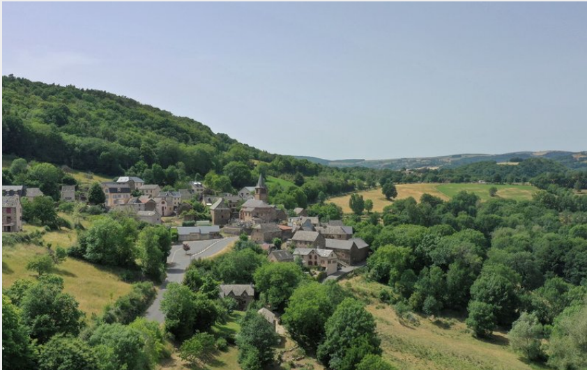
Le village de Nogaret, les balcons de l'Aubrac