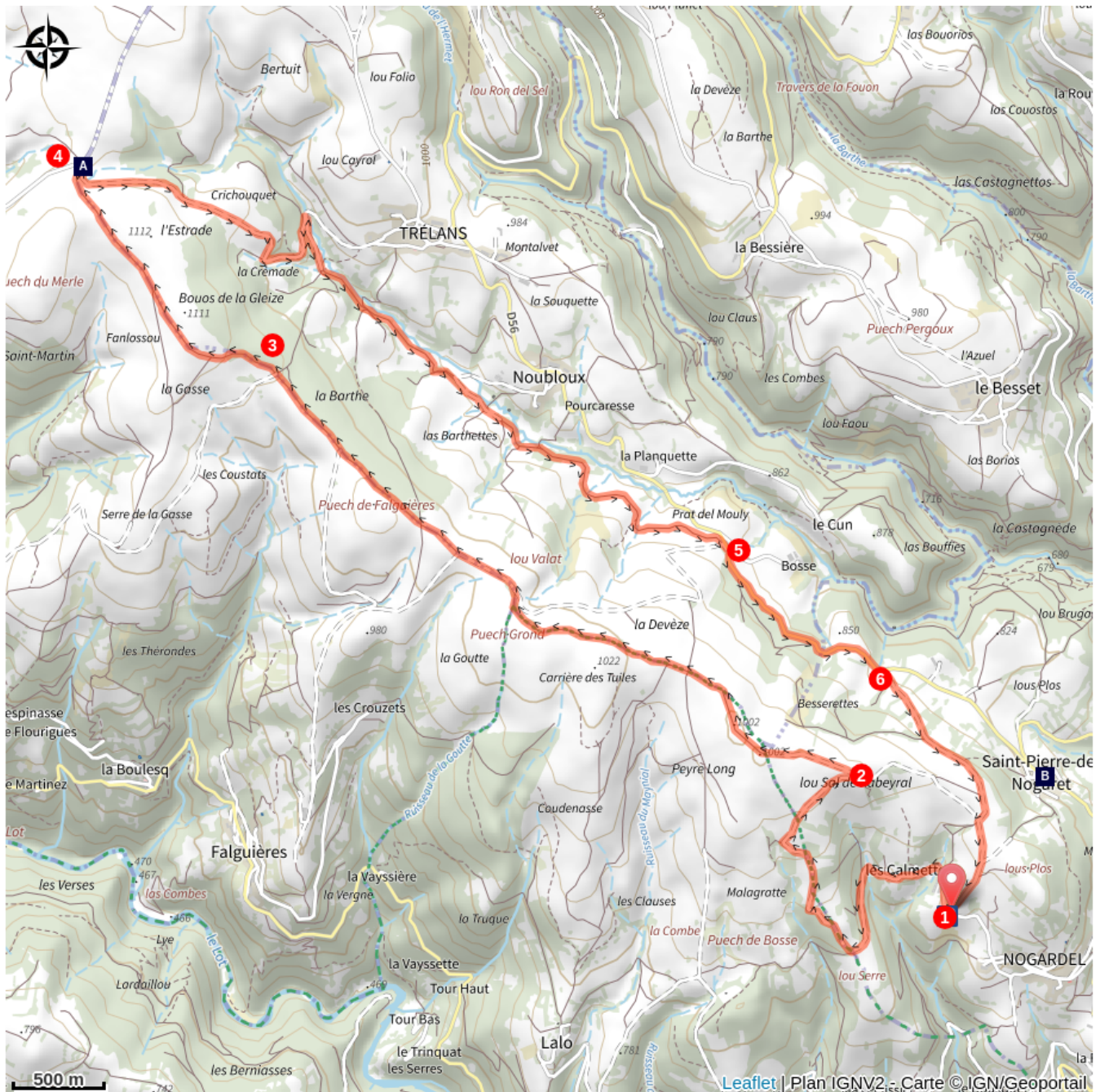
La Croix du Pal (A)