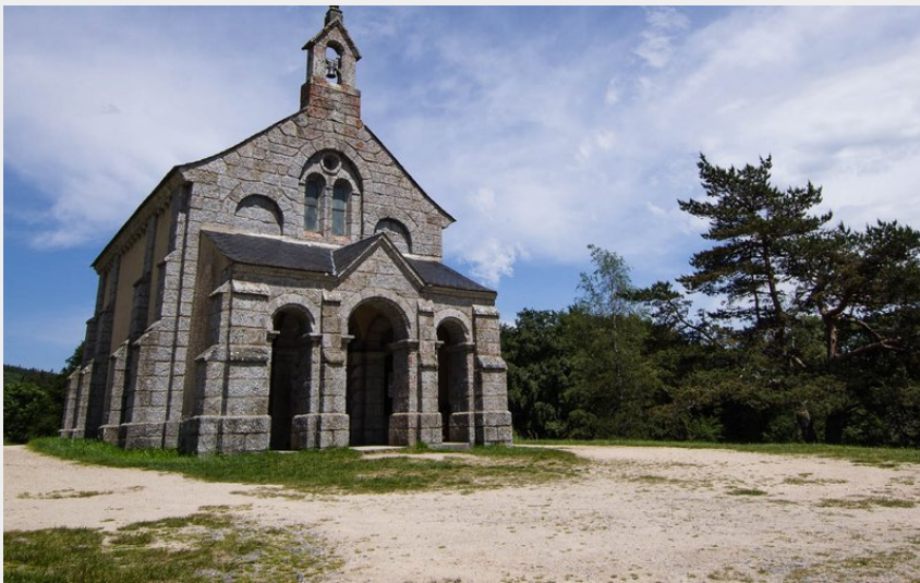
La chapelle Saint Roch