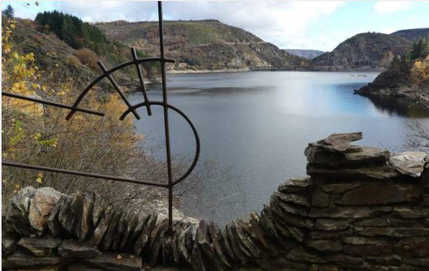
Lac de Villefort (N Thomas)