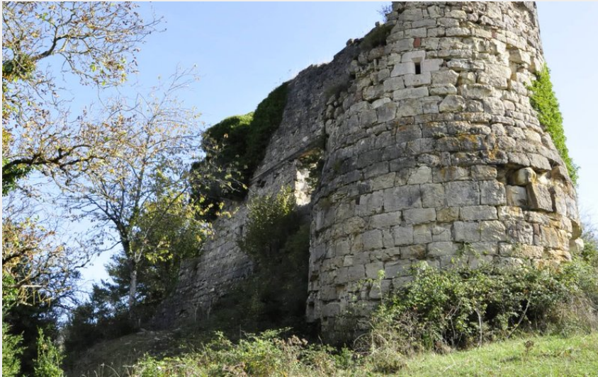
Ruines du château de Montferrand