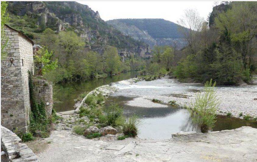
Le Tarn à Sainte-Enimie (nathalie.thomas)