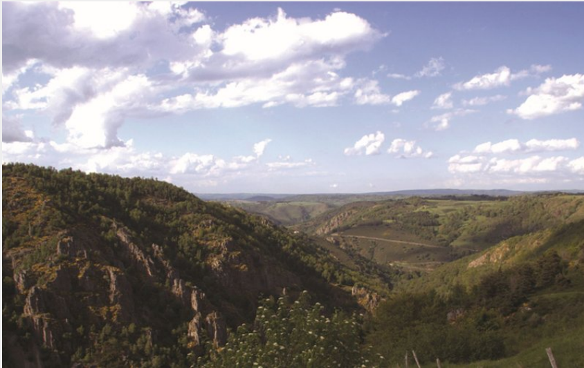
Les gorges du Bès