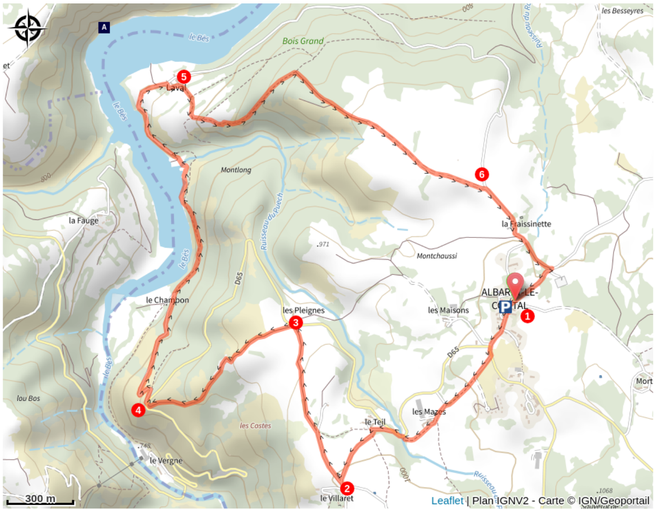
Formation géologique du Bès (A)