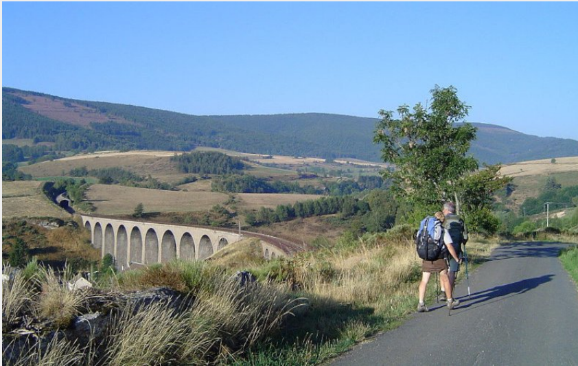
Viaduc de Mirandol, Chasseradès