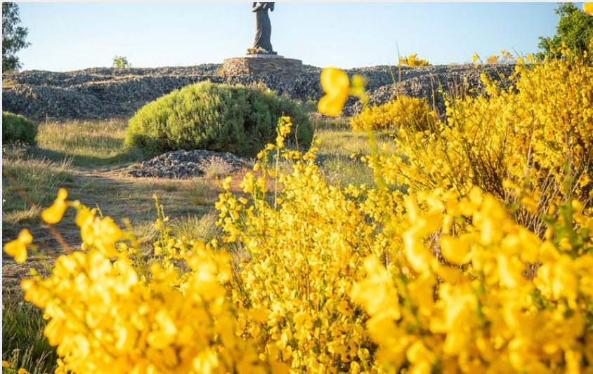
Truc du Cheylaret